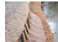
Confortement des berges à Grans