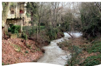
Château de La Barben