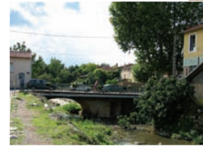
Vue de Péligasse septembre 2005