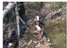
Suppression d'embâcles à St-Chamas