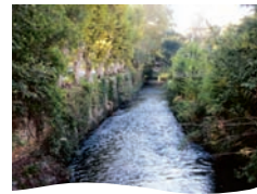
Pont-de-Rhaud à Cornillon-Confoux