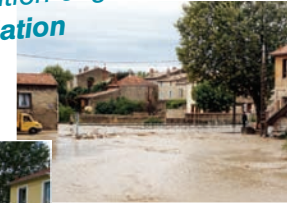
Vue de Péligasse septembre 1993 lors des inondations