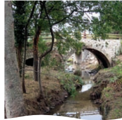
Pont de la Glacière à Puyricard