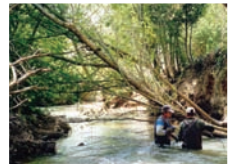
Nettoyage (La Barben)