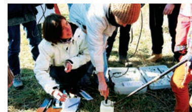
Analyses de l'eau par des étudiants

Suivi de la qualité de l'eau réalisé par le Syndicat depuis septembre 2000 (4 à 5 campagnes de mesures annuelles sur 9 points du bassin versant).